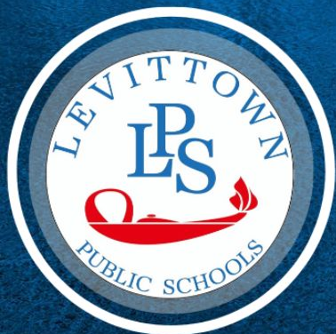
Bus Purchase History